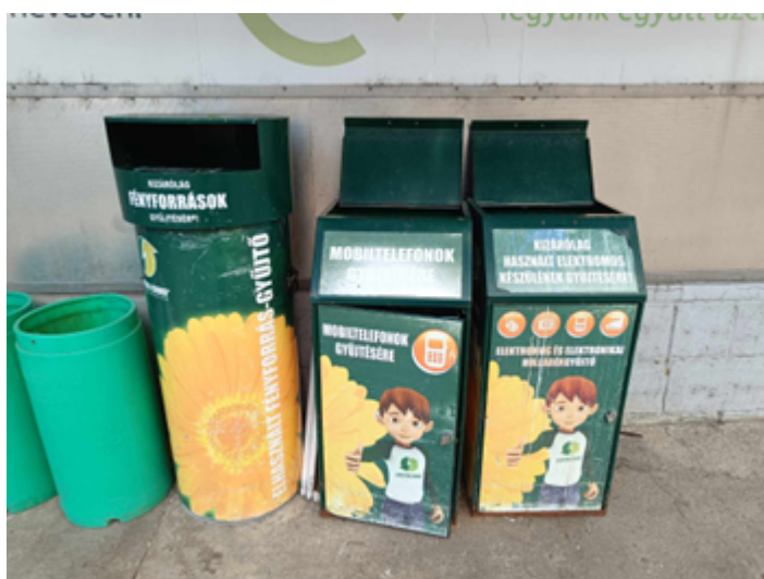
21. kép. Elektromos hulladék szelektálására kihelyezett gyűjtő.

Hulladékgyűjtő udvarokban, szemléletformáló és újrahasznosító központokban történő elhelyezés (21. kép): A hulladékudvarokba bizonyos típusú veszélyes hulladékokat, építkezésor keletkező törmelékeket lehet elhelyezni. A szemléletformáló és újrahasznosító központba pedig olyan, még használható állapotban lévő tárgyak kerülnek, amikre a tulajdonosok már nem tartanak igényt. Érintésvédelmi okokból, elektromos árammal működő eszközöket (kivéve elemmel, vagy törpefeszültséggel működőket) ide nem lehet leadni.