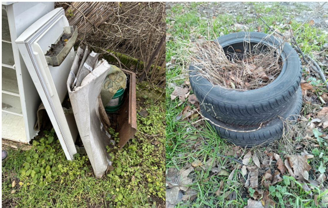
28. kép. Tönkrement hűtő és gumiabroncs.

Speciális lerakó hellyel rendelkeznek például az abroncsok, vegyszerek, olajszűrők, nyomtató patronok, festékhulladék és építési törmelékek.