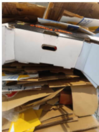
22. kép. Papírhulladék.

gyűjtőszigeteken, illetve hulladékgyűjtő udvarokban. Papír számára a szelektív szemetesek kék színűek. Zsírral szennyezett papírt, zsebkendőket, szalvétát és pelenkát tilos a szelektív papírszemét közé dobni!