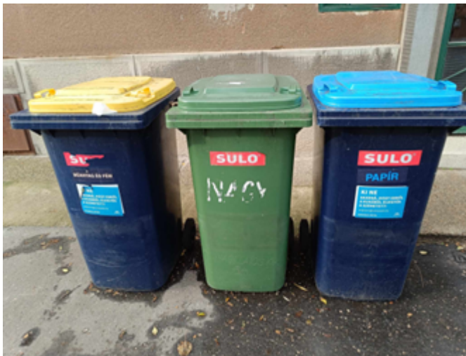
19. kép. Háznál kihelyezett hulladékgyűjtő szemetesek.

Egyénileg, házaknál történő hulladékgyűjtés: Ez magába foglalja a „házhoz menő” szelektív hulladékgyűjtést, illetve a „házhoz menő” zöldhulladék begyűjtését (19. kép). A szelektív hulladékok közül ez a következőket tartalmazza: kék színnel jelölt szemetes: papírhulladék, sárga színnel jelölt szemetes: műanyag és fém hulladék.