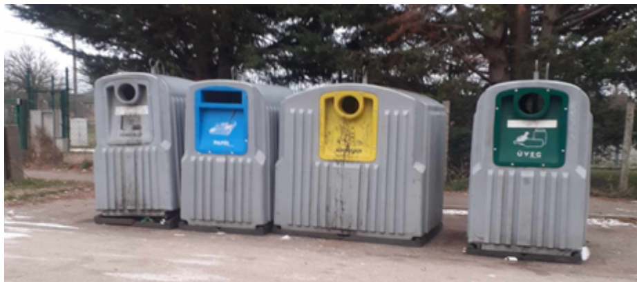
20. kép. Szelektív hulladékgyűjtő sziget Budapesten.

Hulladékgyűjtő udvarokban, szemléletformáló és újrahasznosító központokban történő elhelyezés (21. kép): A hulladékudvarokba bizonyos típusú veszélyes hulladékokat, építkezésor keletkező törmelékeket lehet elhelyezni. A szemléletformáló és újrahasznosító központba pedig olyan, még használható állapotban lévő tárgyak kerülnek, amikre a tulajdonosok már nem tartanak igényt. Érintésvédelmi okokból, elektromos árammal működő eszközöket (kivéve elemmel, vagy törpefeszültséggel működőket) ide nem lehet leadni.