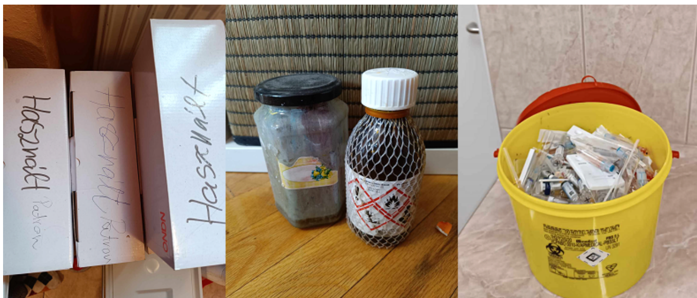
29. kép. Használt patron, festék és oldószer, orvosi veszélyes hulladék.

Speciális lerakó hellyel rendelkeznek például az abroncsok, vegyszerek, olajszűrők, nyomtató patronok, festékhulladék és építési törmelékek.