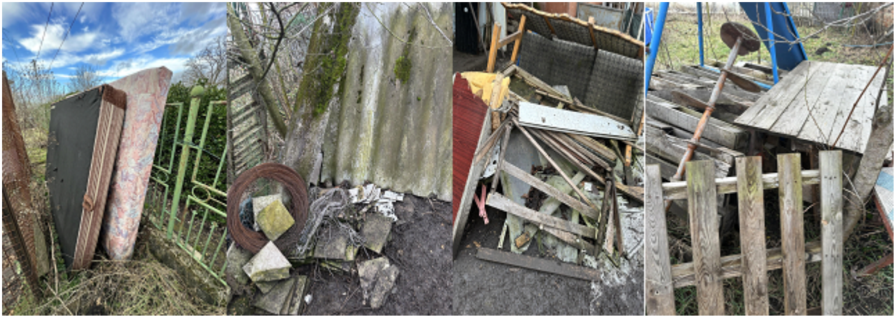
30. kép. Kerti lomok.

kijelölt hulladékudvarokban lehet lerakni, gyakran előzetes egyeztetés alkalmával. Másik alkalom erre a lomtalanítás, ami helyenként változó időpontban történik. Ilyenkor a házak vagy lakások elé kihelyezett lomokat egy adott időpontban elszállítják.