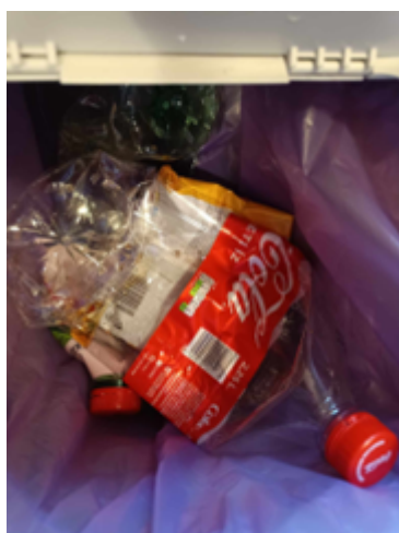
23. kép. Műanyag hulladék.

Műanyag hulladék (23. kép): Ide tartoznak a műanyag PET palackok lecsavart kupakkal, flakonok, fóliák. Másik nagy csoportja az italos kartondobozok például tejes-, gyümölcsleves dobozok (2022. január 1-től). Fontos, hogy ezeket azonban csak öblítés után dobjuk a szelektív szemetesbe. A kupakokat minden esetben le kell csavarni, majd a flakon összelapítása után visszacsavarni. Ezeket kidobhatjuk háznál történő hulladékgyűjtőbe, szelektív gyűjtőszigeteken, vagy hulladékgyűjtő udvarokban. Fontos azonban, hogy a hungarocellt a hulladékgyűjtő udvarokba vigyük, illetve, hogy ne dobjunk a műanyag szelektívbe zsíros vagy vegyszeres flakonokat.