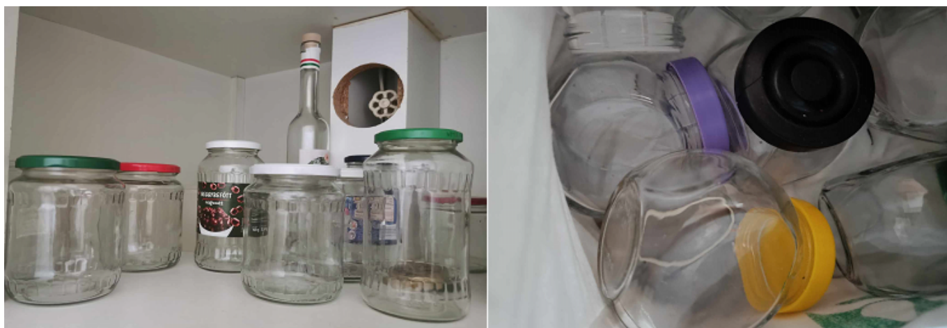
24-25. kép. Befőttes üvegek (Fotó: Kiss Boglárka).

Fehérüveg-hulladék (24-25. kép): Gyűjtőszigeteken és hulladékgyűjtő udvarokban tudjuk szelektíven gyűjteni. A szelektív szemetes színe: fehér. Ne dobjuk ki síküveget, ami például tükör vagy ablaküveg. Továbbá nem kerülhet a szelektív szemét közé villanykörte, veszélyes hulladékos üveg, vagy hőállóüveg.